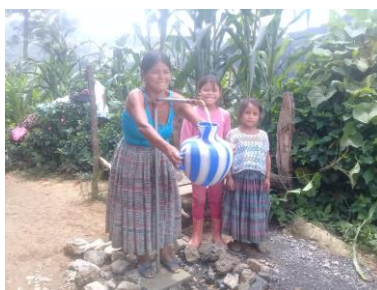
water in San Marcos Chamil