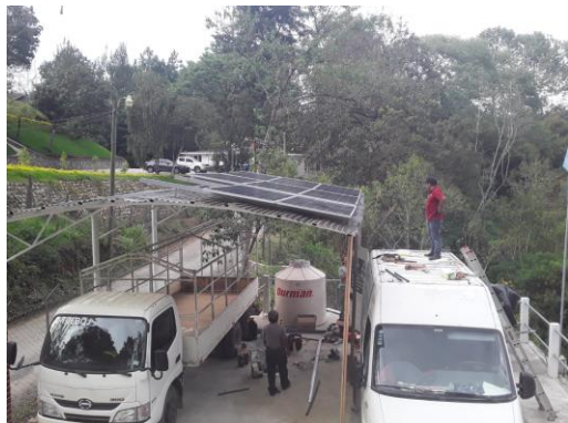
aanleg van de zonnepanelen op het dak van het kantoor