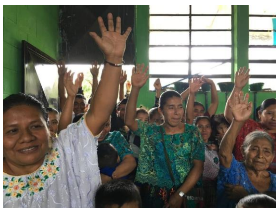
alle handen de lucht in bij de vraag: Wie doet er mee?!! Mmmmm..... pepernoten uit Nederland