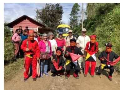
ontvangst bij de inauguratie

Eerst het verhaal over ons bezoek aan Adicay waar we zoals gebruikelijk met open armen werden ontvangen. Tot onze grote verrassing was er die ochtend een filmploeg in ons hotel die de samenwerking tussen Adicay en Ayuda Maya op film vastlegde. Ze volgden ons tijdens ons bezoek bij de inauguratie en het resultaat is een prachtige presentatie geworden, een die we graag willen laten zien zodra het weer mag! 😊