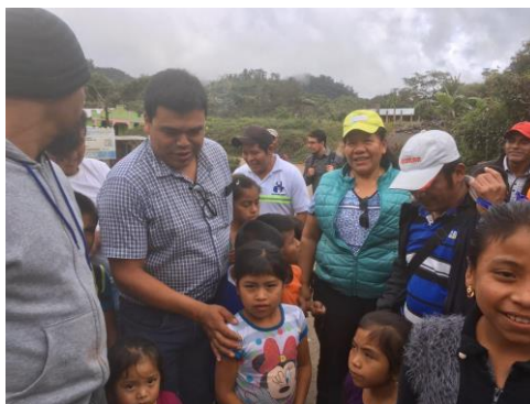
drukke bij de aankomst in San Antonio Sepacuite