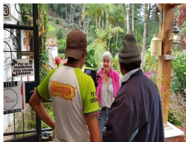
beetje onwennig...voor de camera

We hebben als bestuur ons beraden wat te doen en, een geluk bij een ongeluk, was daar onze samenwerkingspartner Wilde Ganzen die uitzicht bood. Daarover later meer in deze nieuwsbrief.