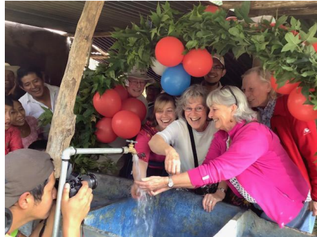
water in San Marcos Chamil