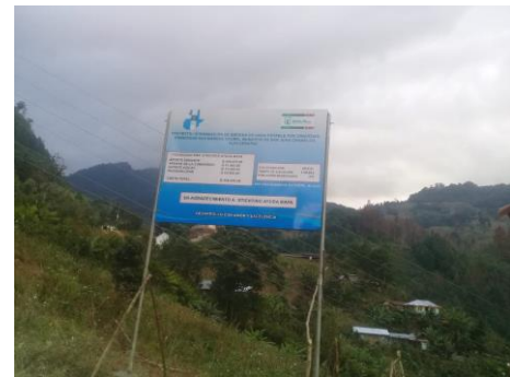
bord langs de weg in San Marcos over project

Ook dit jaar hebben we weer een dorp blij kunnen maken door de afronding van een waterproject: San Marcos Chamil. Een dansgroep, knalvuurwerk, ballonnen, de volksliederen en toespraken: het was er allemaal en het uitgebreide verhaal van deze dag is te lezen op onze website. Enkele foto's hiervan spreken voor zich.