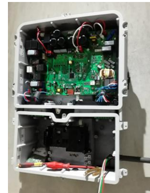
interieur van de technische installatie