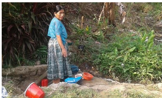
Nu aangewezen op deze poel

We gaan dus onze bronnen weer aanboren om aan het benodigde bedrag te komen en uiteraard werken we hierbij ook weer graag samen met Wilde Ganzen.