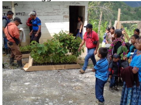
Aankomst jonge planten en bomen