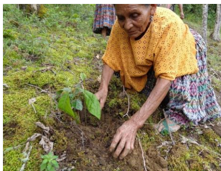
Jong en oud helpt mee