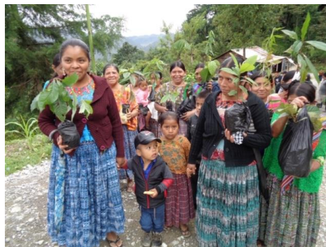
In optocht bergopwaarts