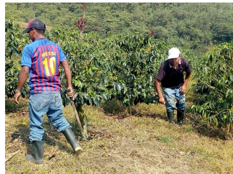
De mannen aan het werk op de koffieplantage