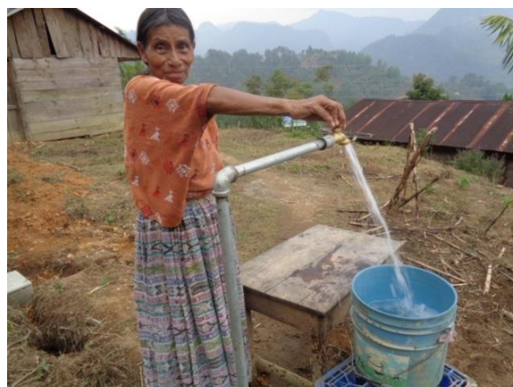
Zo blij met deze kraan voor de deur