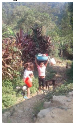
Ook kinderen helpen mee